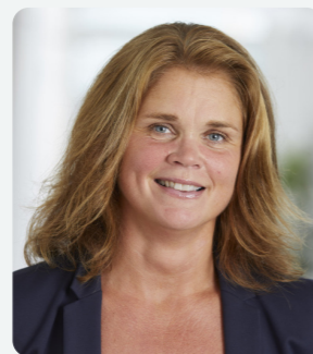
Var rädd om varandra och God Jul!

Hoppas att ni också hittar era nya sätt att kommunicera, involvera och engagera under denna annorlunda tid. Världen ändras och vi med den.