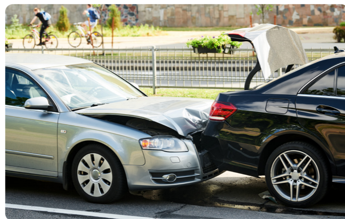
Text: Örjan Backlund

Prognoserna på nybilsförsäljningen är nedskruvad med cirka 25 procent på personbil och lättare transportbilar för 2020. En tydlig trend är förflyttningen av verkstadsjobben som nu är utanför storstadsregionerna då vi nu jobbar mer på distans från andra platser än de normala.